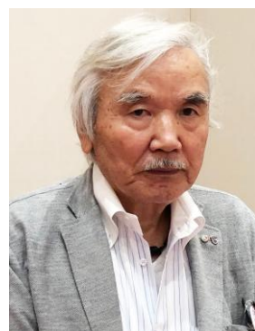
岩見国際・交流委員長