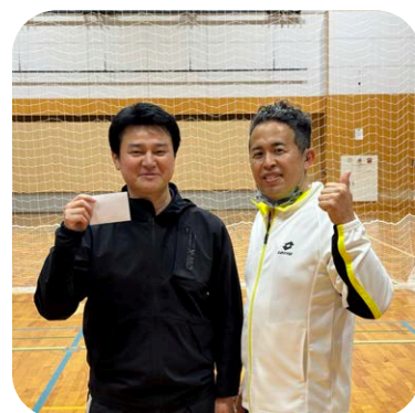
優勝した池袋ワイズと桶谷会長